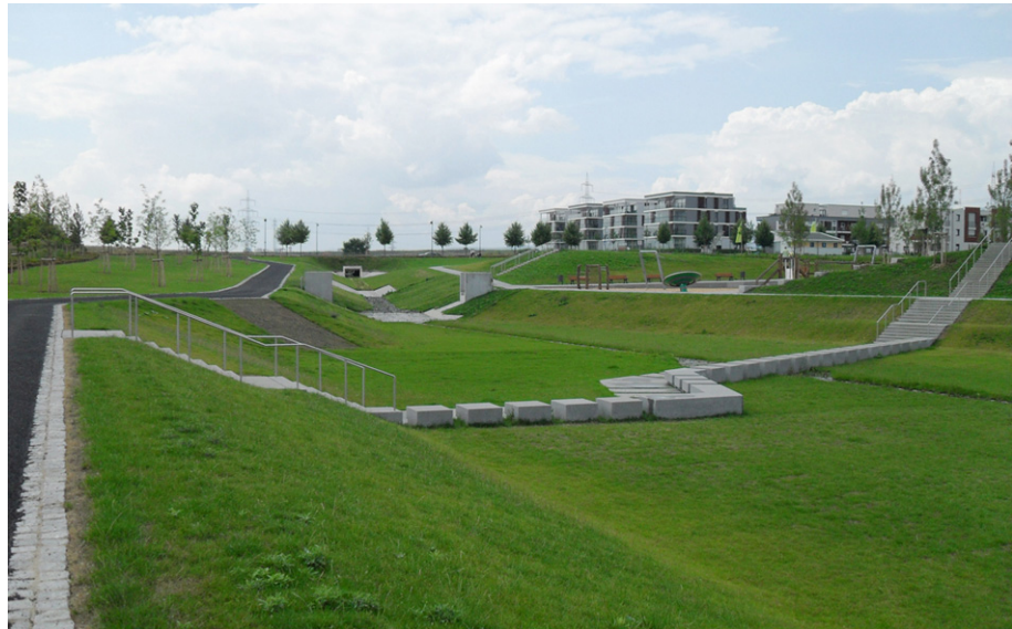
Abb. 3: Regenwasserbewirtschaftungsanlage auf dem Riedberg